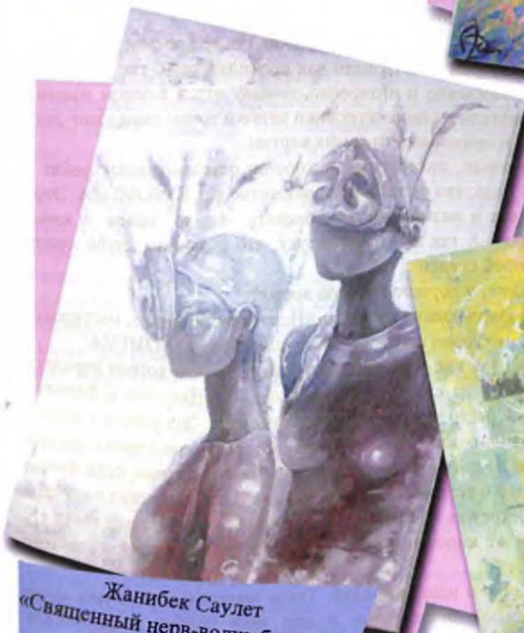
Жанибек Саулет «Священный нерв-волшебный яд»