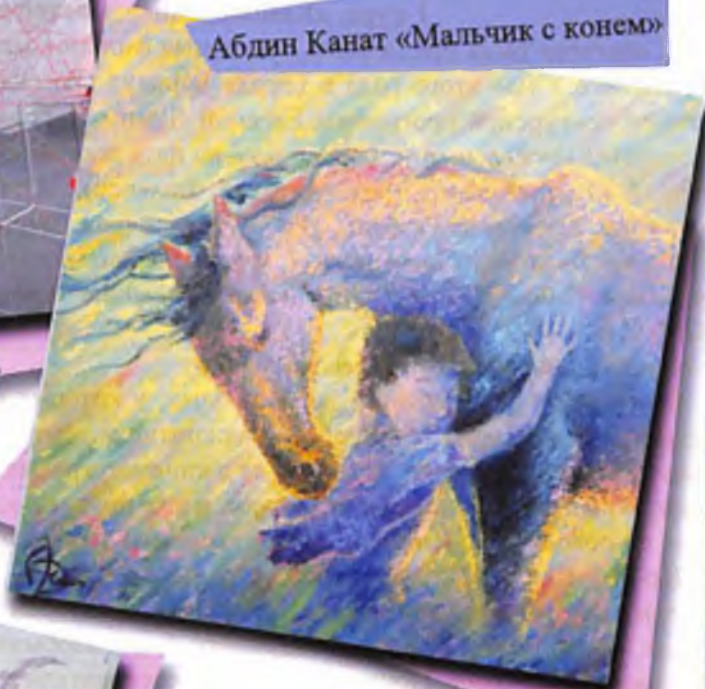
Абдин Канат «Мальчик с конем»