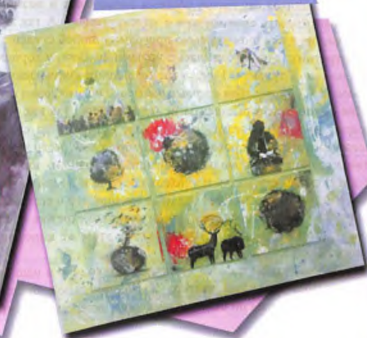
Жанибек Саулет «Биографика»